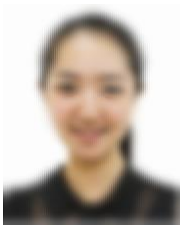
（证件照标准示例照片）

1.本人近三个月内正面、免冠、无妆、无美颜及修图、彩色头像电子证件照（白色背景，该照片将用于初试准考证、学信网录取登记表等重要材料照片和考生身份验证，考生务必慎重对待）。