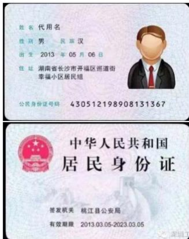
(身份证正反面示例)