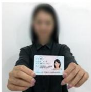
(手持身份证照片示例)