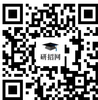
网上确认系统二维码

考生可以使用手机、电脑等进入网上确认系统。进入登录页面后，输入本人网上报名的学信网账号、密码即可登录系统。考生应全程根据网页提示和要求内容依序操作，直至完成材料提交全过程。建议考生尽量错峰确认，不要在确认的最后一天扎堆提交审核材料，以免由于审核未能通过需要进一步提供的材料没有充足的时间及时补充。